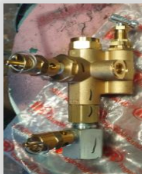
Cambio de válvula reguladora RPM