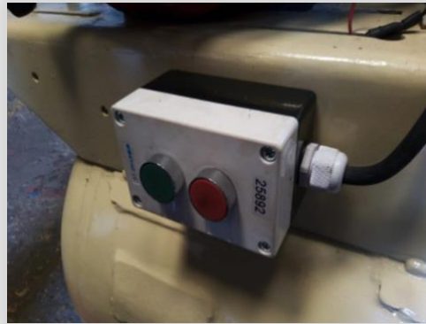
Cambio de Encendido eléctrico