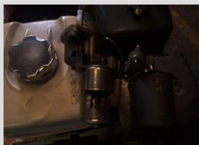
Cambio de motor de arranque