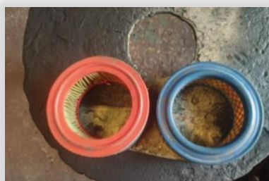
Cambio de filtros