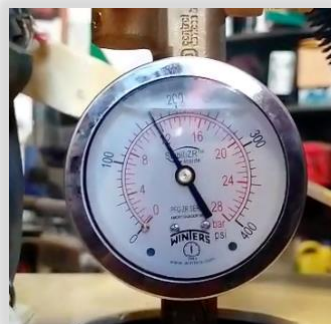
Cambio de manómetro